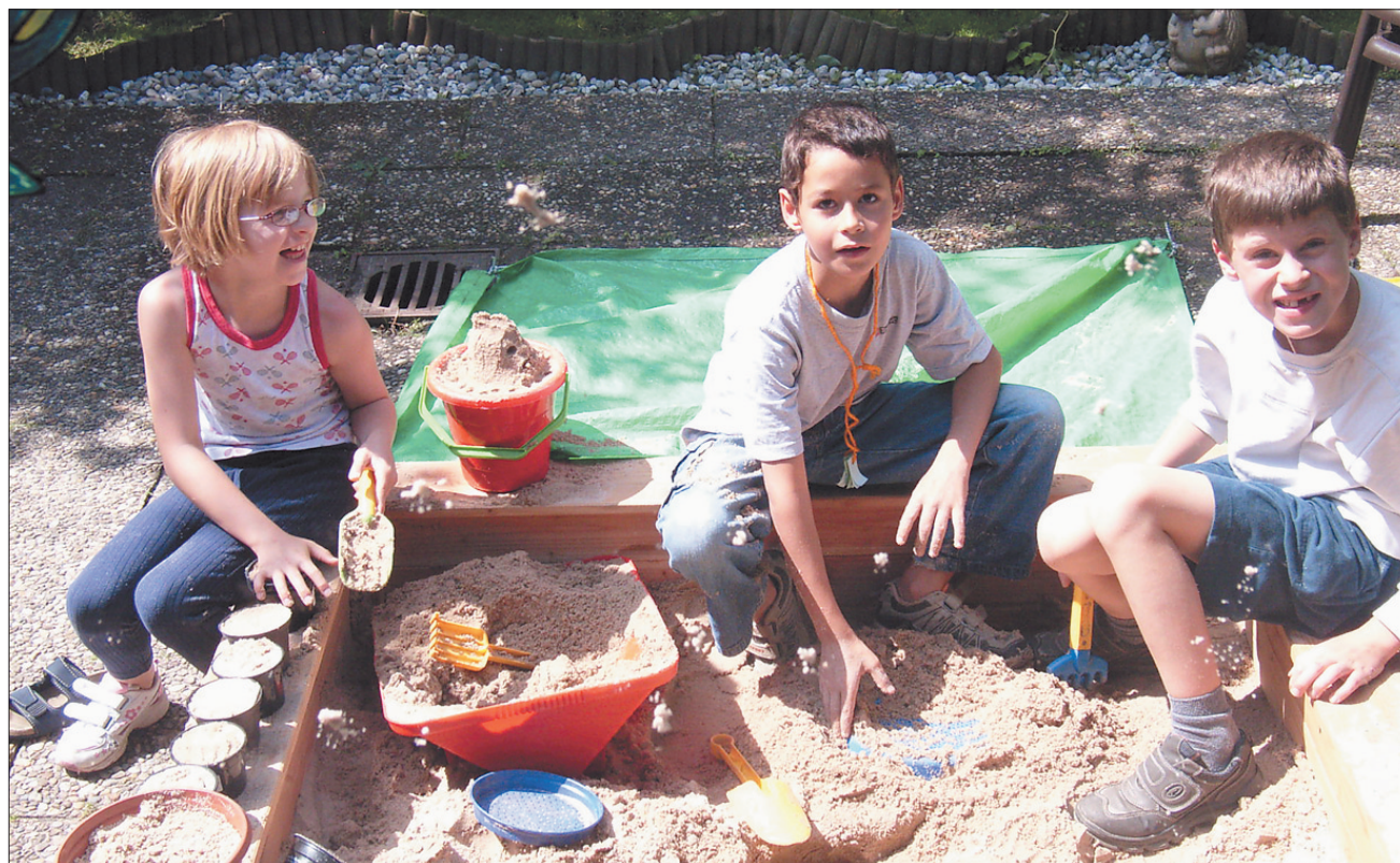
Sinnvoll beschäftigte Kinder neigen seltener zu Problemverhalten.

Kaum jemand wird als strategisch abgebrühter Erziehungsprofi geboren. Erziehen heisst auch: Auspro-